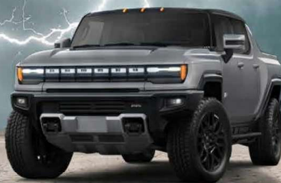
GMC HUMMER EV